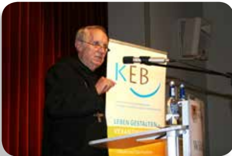
Abtprimas em. Notker Wolf am 17. Januar in Weißenburg mit „Schluss mit der Angst“